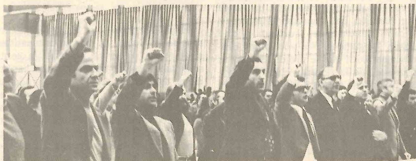
Les congressistes répondant au salut de Pliouchtch.