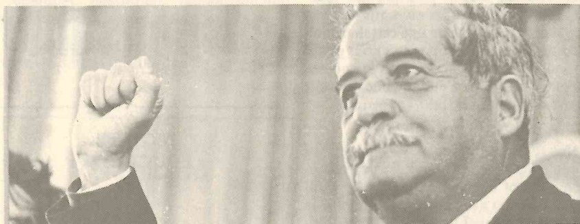
Elgueta, secteur enseignement de la C.U.T. Chili.